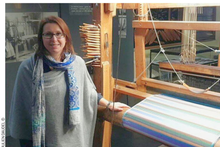
JULIEN DAUDEL ©

« Pour Saint Étienne, se réjouit S. Mura, c'est une vraie fierté, c'était une gageure de les faire venir malgré la barrière géographique et symbolique du Forez. »