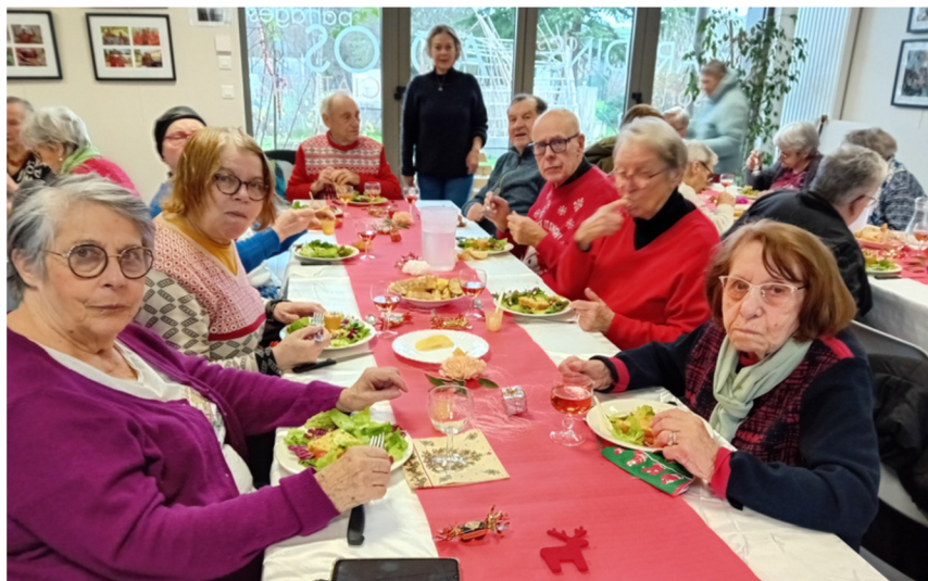
Repas partagé du 19 Décembre 2025