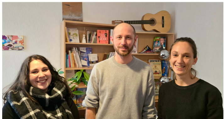
L'ÉQUIPE DU COCON

Voilà maintenant 18 ans que cet espace existe. Il s'est adapté aux demandes qui ont évolué en raison des changements sociétaux ou d'événements ponctuels.